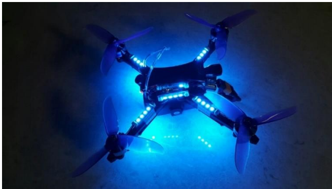
Ref. 2 LED 샘플