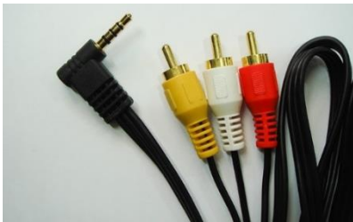
Ref. 1 리시버 케이블 샘플